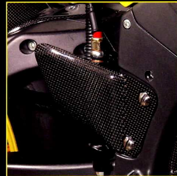
Hälskydd (Förare, 2 delar) Heel Protectors (Front – 2 pce.)