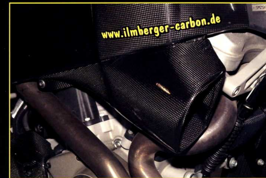
Stort luftintag höger Big Airduct (right)

RIGHT BIG AIRDUCT The shape of the right airduct is made to maximise the air-cooling of the front and rear cylinder, throughout the speed range. The cooling is so improved that the cooling fan that runs all the time with the original OE duct, only runs occasionally with our duct. This cuts down dramatically on the amount of noise from the fan.