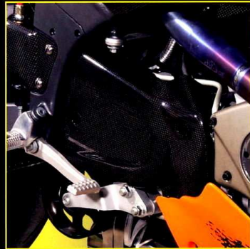
Pulleykåpa Pulley Cover