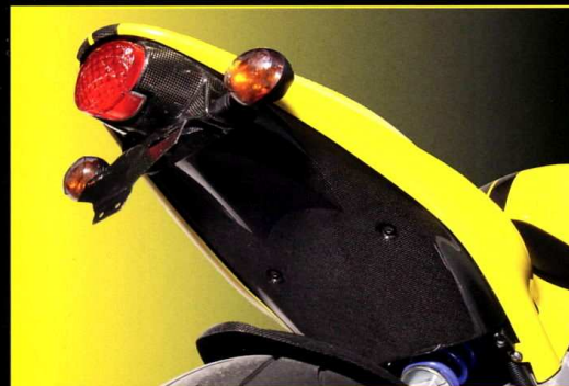
Hjulhusunderkåpa Rear Undertray