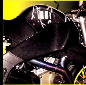
Ramskydd höger Frame Cover (right)