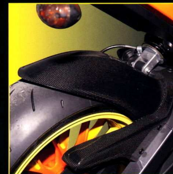
Stänkskärm bak Rear Hugger

REAR MUDGUARD SS The rear hugger reduces considerably that amount of dirt and spray thrown up by the rear wheel and provides much needed protection to the underseat area. The upper belt cover is included with the hugger.