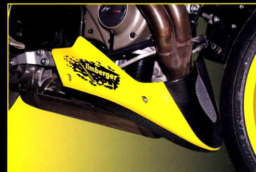
Motorspoiler kort Bellypan short