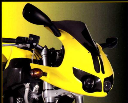
Frontkåpa Strada Front Fairing Street