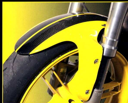
Stänkskärm fram Front Mudguard

The very attractive design and appearance of this bike is particularly suited to the use of carbon fibre. We make sure that the parts are made as light and as strong as possible. This is not only provides a weight reduction, but it also makes the bike look lighter and also dramatically increases the perceived quality and price of the complete package. The use of our very special and exclusive clear plastic powder coating on the carbon is more scratch and stone-chip resistant than a normal lacquer. The coating is also UV resistant.