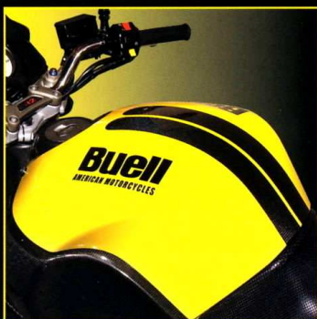
Airboxkåpa / Tankatrapp Airbox Cover