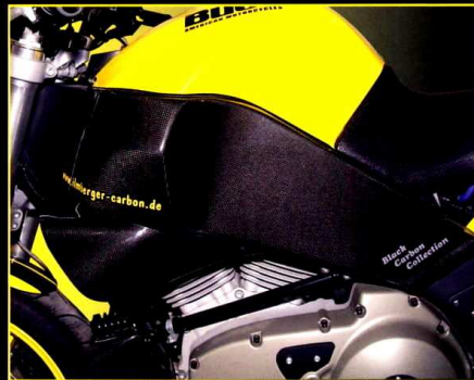
Ramskydd vänster Frame Cover (left)