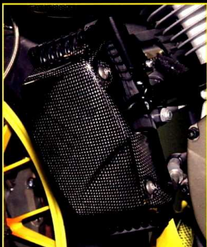
Oljekylarkåpa Oil Cooler Cover