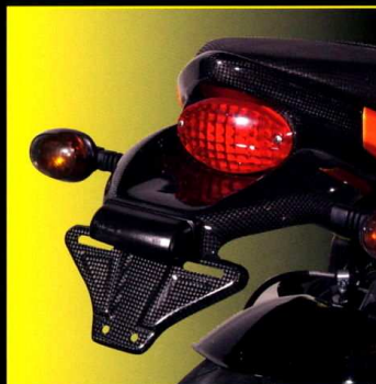
Registreringsnummerhållare / kort bakdel Number Plate Holder / Short Tail