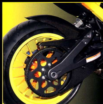
Belskydd under svingarm Lower Belt Cover