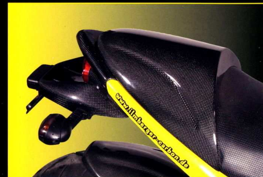
Passagerarsitskåpa Seat Cover