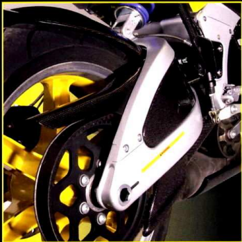
Beltskydd på/under svingarmen / svingarmkåpa höger Upper / Lower Belt Cover / Swing Arm Infill Panel