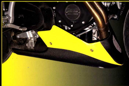
Motorspoiler lång Bellypan long