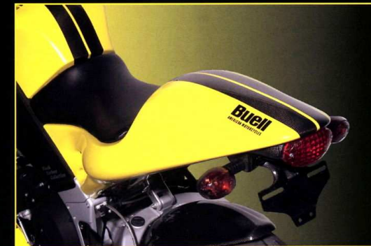
Sits med registreringsnummerhållare Seat Unit with Number Plate Holder