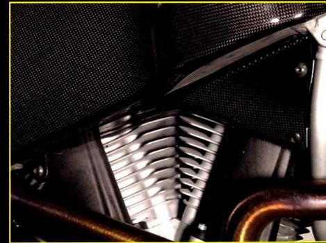
Luftintag höger Airduct (right)