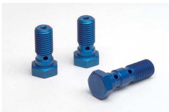
Som extra till bromsslangskitet salu för LSL färgad eloxerad Banjo-Bolt.

Om en viss modell inte finns i tabellen, skicka gärna in era bromsslangar. Vit tillverkar sedan exakt enligt er inskickade förlagor med ev modifiering.