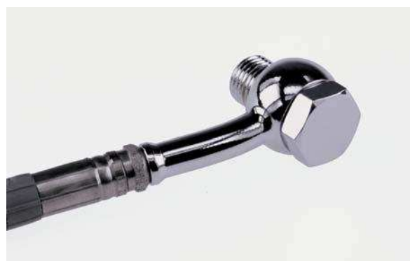
Fitting: kromad Banjobolt: kromad