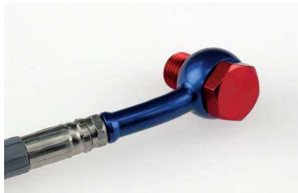
Fitting: blå Banjobolt: röt