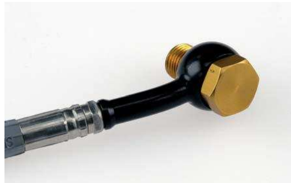
Fitting: svart Banjobolt: guld