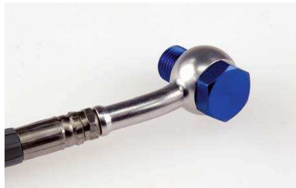
Fitting: silver Banjobolt: blå